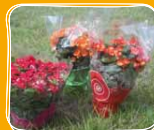
→ Housse modèle Secundo

Holimco a développé ce modèle pour des pots de 17 à 20 cm, et pour les coupes de plantes fleuries de diamètre 20 à 25 cm. Ses coloris lumineux apportent une valeur ajoutée à vos potées et coupes pour favoriser l'achat d'impulsion.