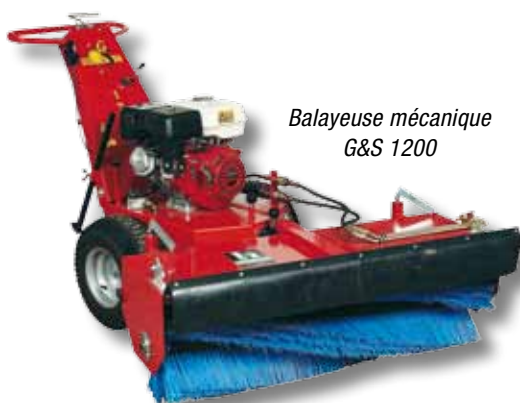
Balayeuse mécanique G&S 1200