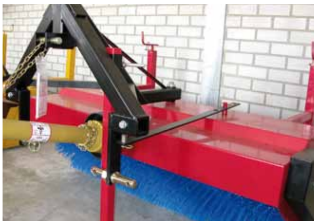
Brosse adaptable sur un tracteur.