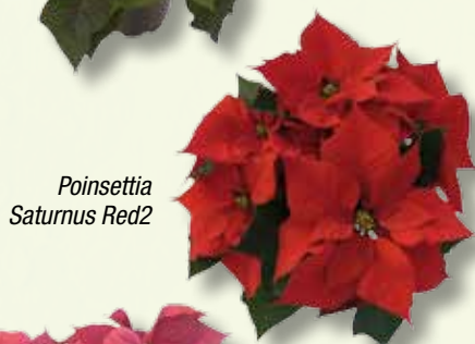
Poinsettia Saturnus Red2