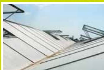
Serre après application de ReduHeat.