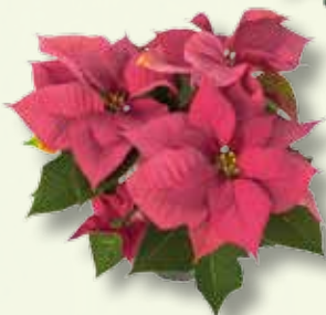
Poinsettia Saturnus Pink