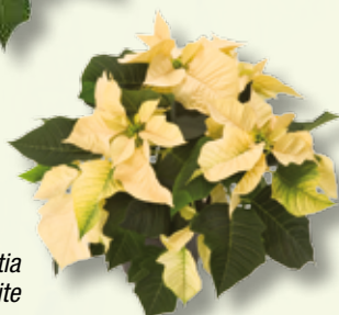
Poinsettia Saturnus White