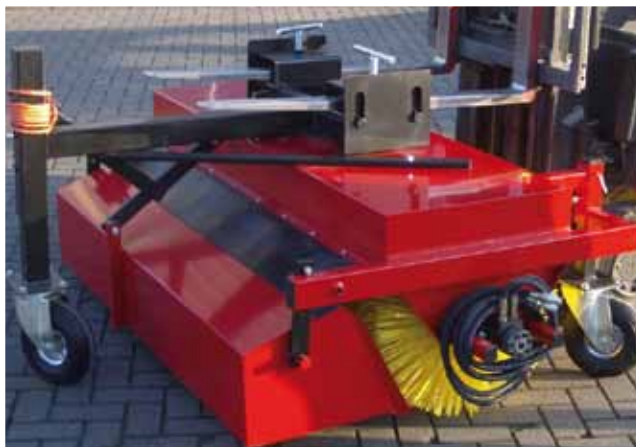
Brosse adaptable sur les fourches d'un chariot élévateur.

Dans tous les cas, des machines « pro », adaptées à votre situation.