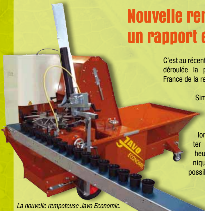
La nouvelle rempoteuse Javo Economic.

Munie d'un carrousel de 8 supports de pots, ajustables en 2 temps - 3 mouvements, elle assure le remplissage de pots ronds ou carrés, de 7 à 22 cm.