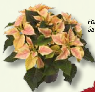
Poinsettia Saturnus Marble

L'ensemble des variétés proposées par Beekenkamp sont issues de son propre programme de sélection et d'amélioration.