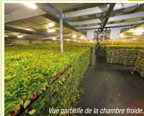
Vue partielle de la chambre froide.

ce qui permet de mieux gérer le froid et les déplacements des plantes : rentrée au frigo, effeuillage, retour au frigo et stockage en attente d'expédition.