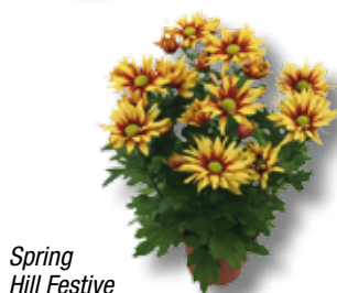
Spring Hill Festive

Pensez à passer vos commandes dès maintenant.