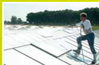
Application de ReduSol.

Mardenkro a été le premier à commercialiser un produit d'ombrage couplé à son produit de nettoyage (duo ReduSol + ReduClean). Grâce à sa forte capacité d'innovation, Mardenkro a également créé ReduHeat, le premier écran réduisant la température intérieure tout en laissant passer la lumière d'assimilation « PAR ». ReduHeat est, lui aussi, nettoyable avec ReduClean.