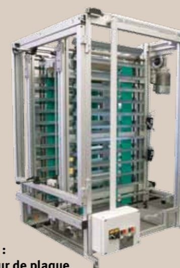
Option : dépilleur de plaque