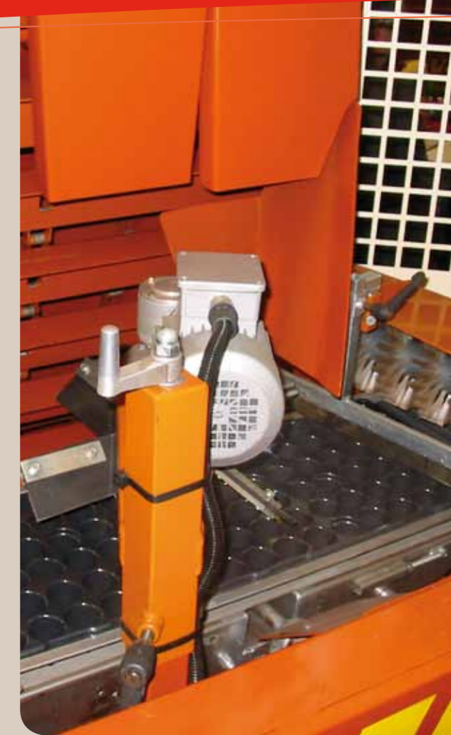
Rotor et brosse

Permet d'augmenter la capacité de stockage de la machine. Volume 1400 litres. Dans la version illustrée, la machine est de plus équipée de roues arrière pneumatiques pivotantes avec timon.