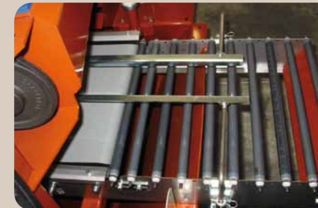
Sortie des plaques sur rouleaux et retour du terreau excédentaire dans la trémie