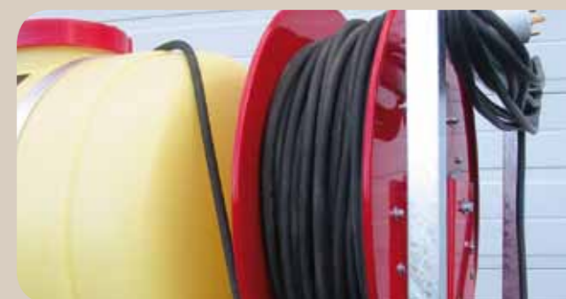
Enrouleur par ressort, avec cliquet d'arrêt