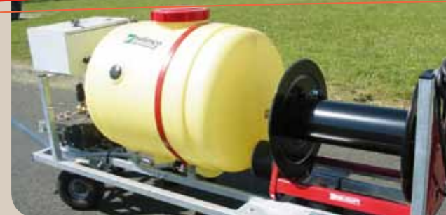
Moteur électrique, enrouleur électrique