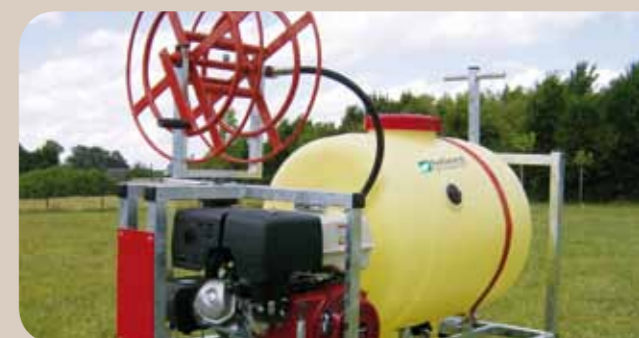
Moteur thermique, enrouleur manuel