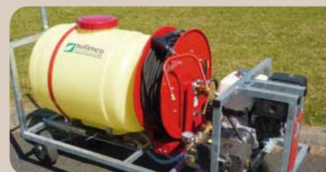
Moteur thermique, à enrouleur à ressort