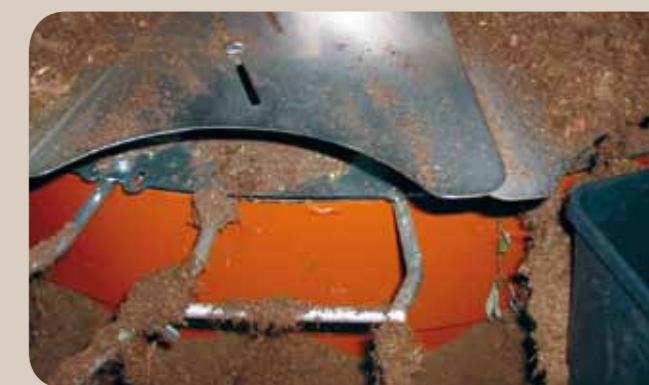
Optima avec option racines nues en pots carrés