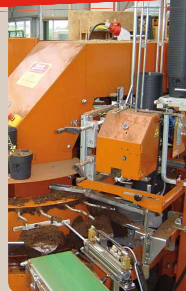
Optima avec distributeur LPO1 et évacuation pneumatique

Le système « Racines nues » est constitué de plaques fixes ou ajustables à la taille des pots. Ce même système peut aussi être utilisé pour des empotages classiques de plants en motte.