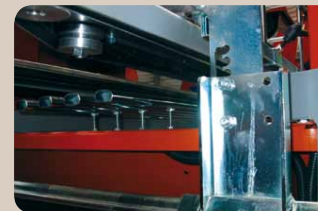
Réglage en hauteur des courroies d'avancement des pots