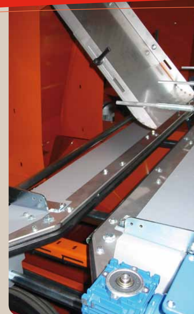
Courroies d'avancement des pots

Possibilité de placer un tapis d'évacuation en sortie.